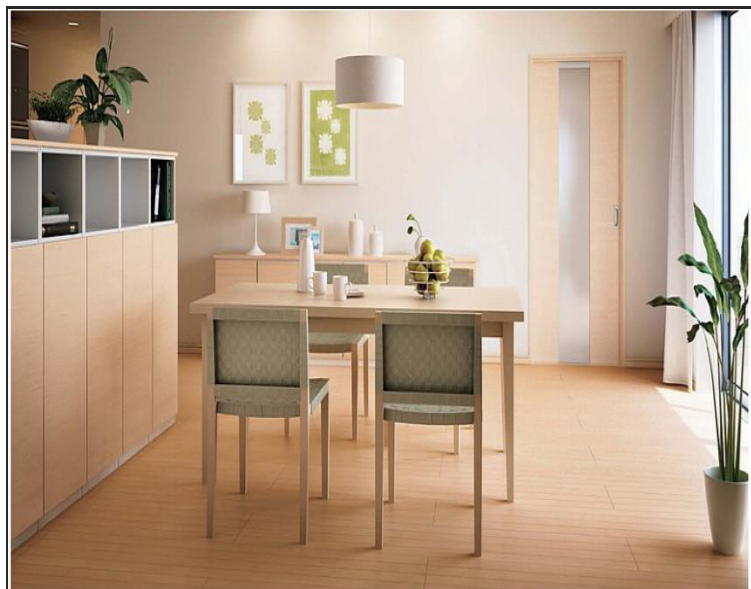
床材：フォレスティア（ミルベージュ）