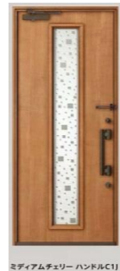
ミディアムチェリー ハンドルC11