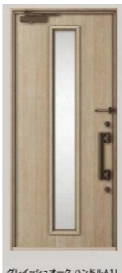
グレイッシュオーク ハンドルA11