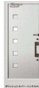
ポリッシュシルバー ハンドルA17