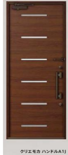
クリエモカ ハンドルA19